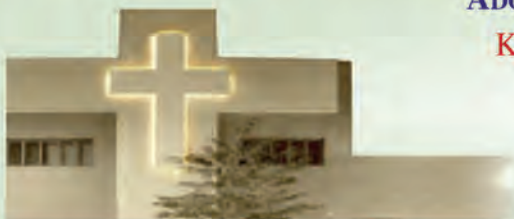
Jezuicki Ośrodek Milenijny

W pierwszy piątek miesiąca - od 17:30 do 19:30